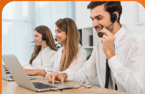
Contact Center Omnicanal