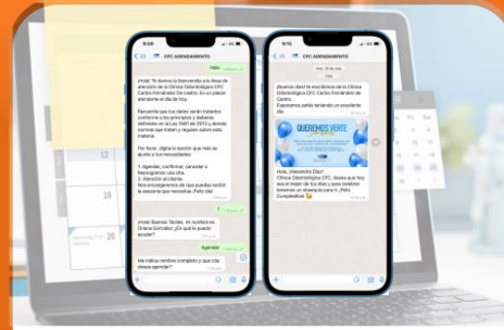
Agendamiento y Gestión de pacientes