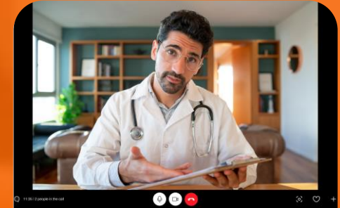
Teleasistencia y Telemedicina